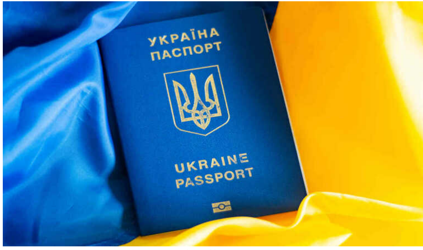
Що потрібно врахувати українцям перед перетином кордону з ЄС

З 2025 року для в'їзду до Євросоюзу українцям необхідно буде отримати дозвіл ETIAS, вартість якого становитиме 7 євро (289 грн). Дозвіл діятиме три роки або до завершення терміну дії закордонного паспорта, а пільгові категорії (діти до 18 років і особи старше 70 років) будуть звільнені від сплати збору.