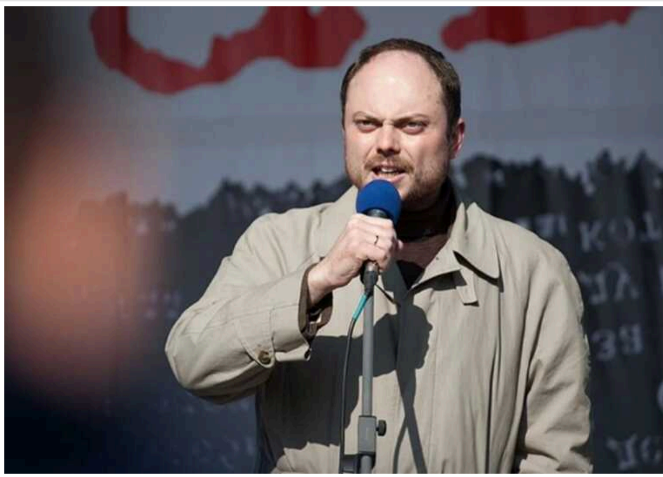
Російський опозиціонер знову закликав Захід послабити санкції проти "звичайних росіян", – The Times

Російський опозиційний політик і журналіст Володимир Кара-Мурза, який був звільнений в рамках обміну ув'язненими між РФ і США, знову закликав Захід ретельно підходити до запровадження санкцій проти Москви, повідомляє The Times. Хоча раніше його позиція вже викликала критику з боку України.