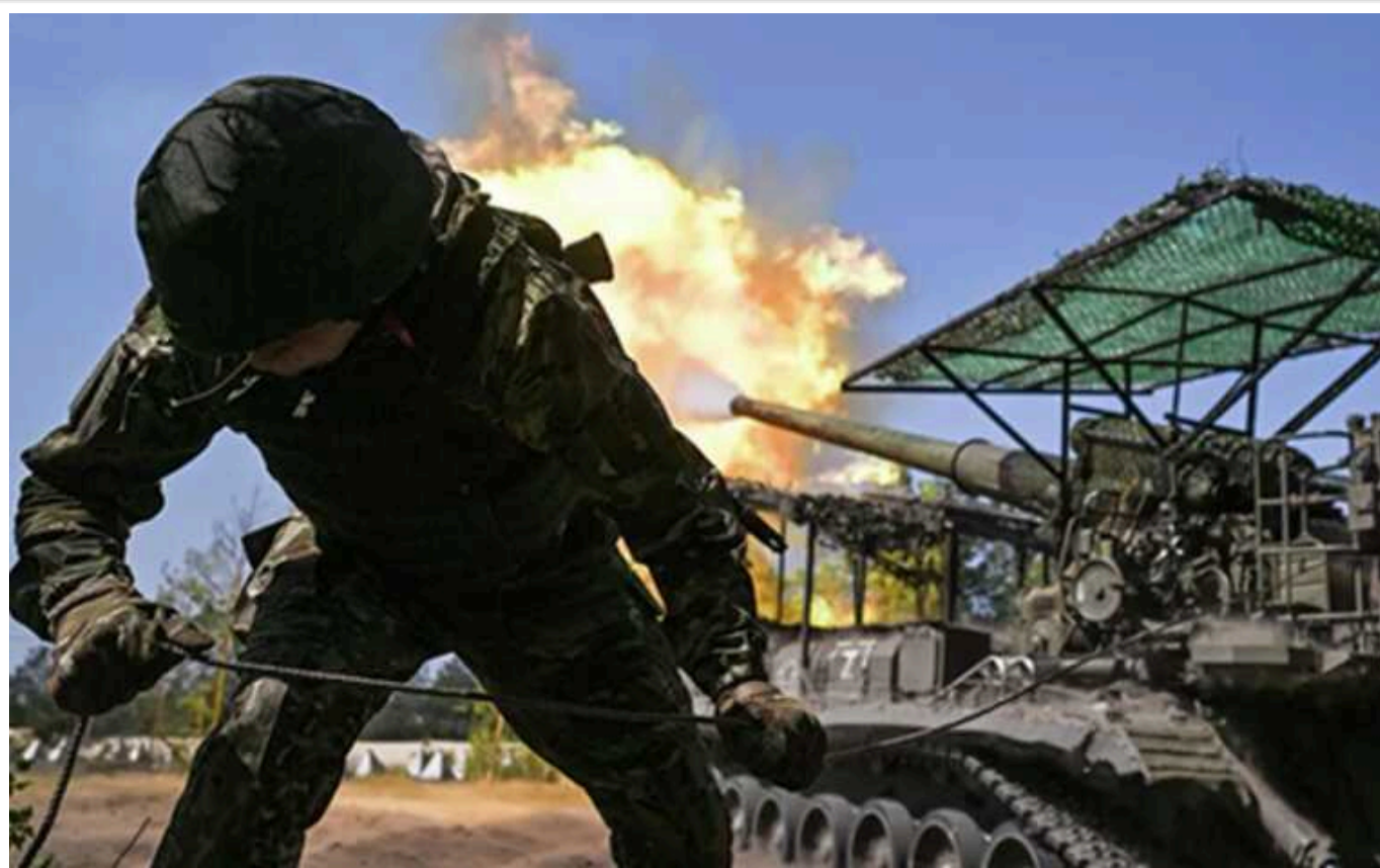
Загарбники вибили підрозділи ЗСУ з терикона під Селидовим і захопили дачі під Вугледаром, – військовий

Кільце навколо Вугледару ущільнюється, тому командування ЗСУ повинно ухвалити якесь рішення, вважає український захисник.