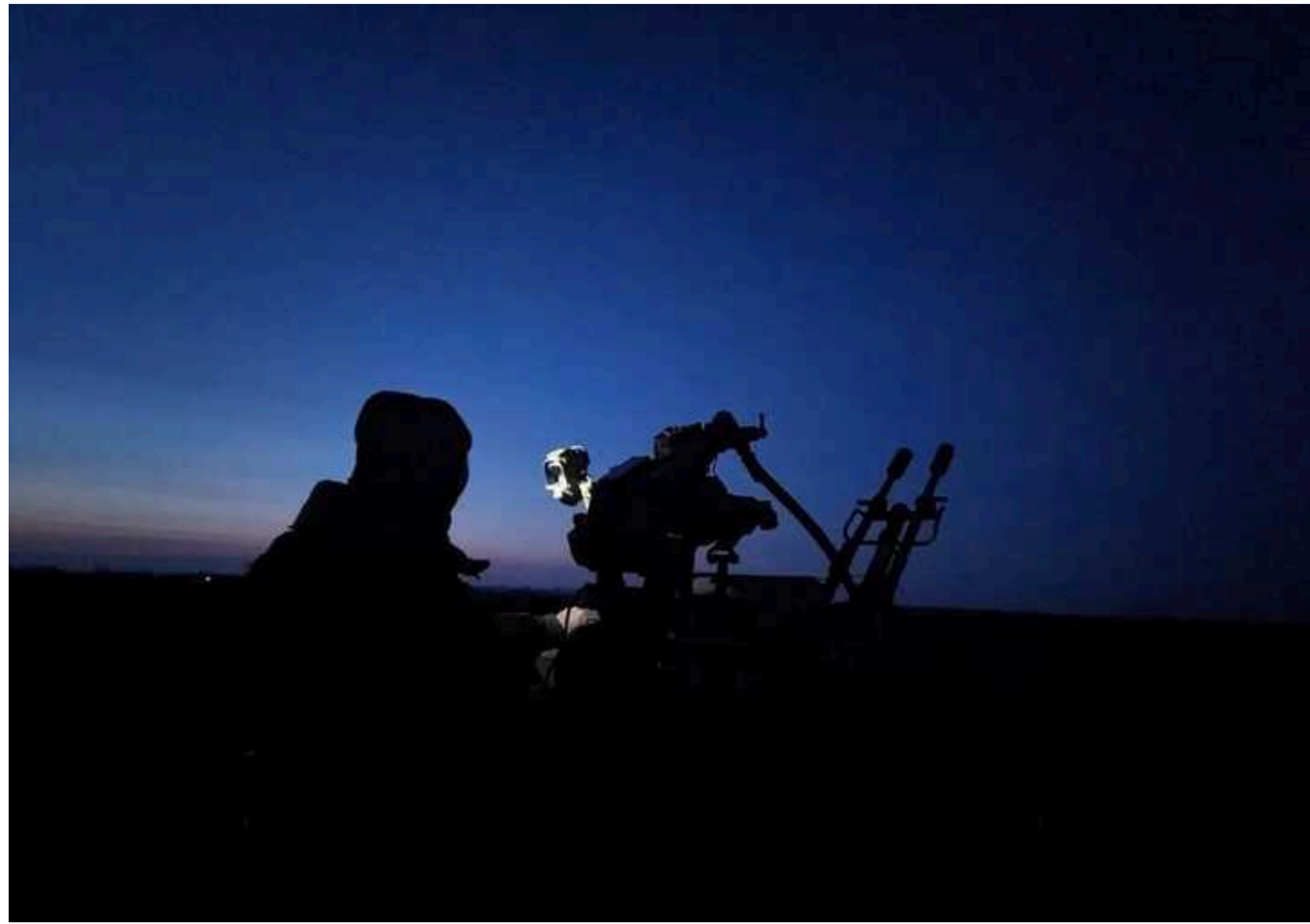
РФ вночі запустила по Україну ракети X-59 і "шахеда": три дрони збили над Сумщиною

Сили протиповітряної оборони в ніч проти 23 вересня знищили в небі над Сумщиною три дрони-камікадзе типу Shahed-131/136. Росія загалом здійснила напад із використанням чотирьох таких БПЛА.