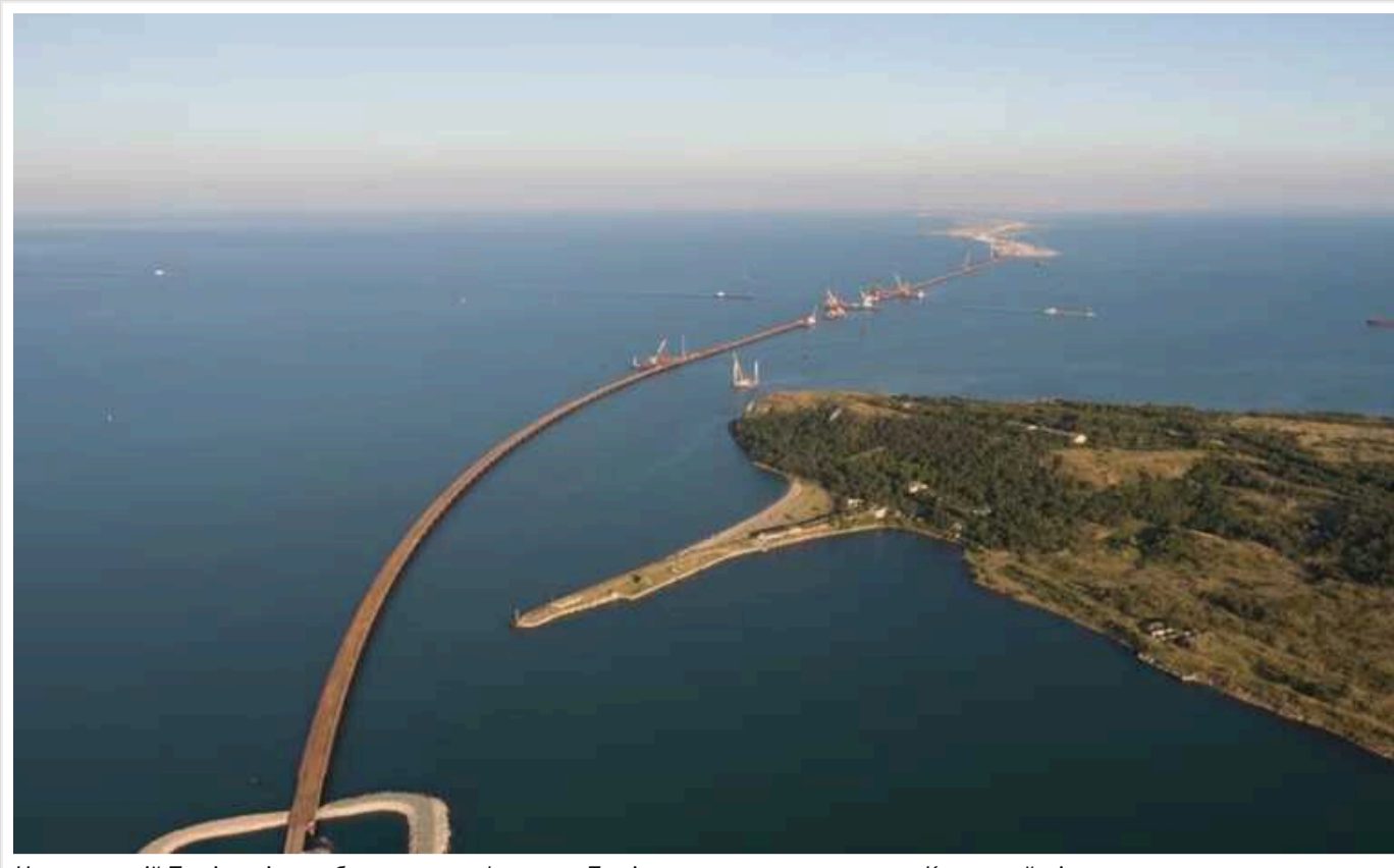
На захопленій Тузлі помітили башти-трансформери: Путін намагається захистити Кримський міст

На окупованому агресором Росією острові Тузла біля Кримського мосту були помічені засоби протиповітряної оборони ЗРПК "Панцирь-С1М", які встановили на металеві башти-трансформери. Висота башт може становити близько 30-35 метрів.