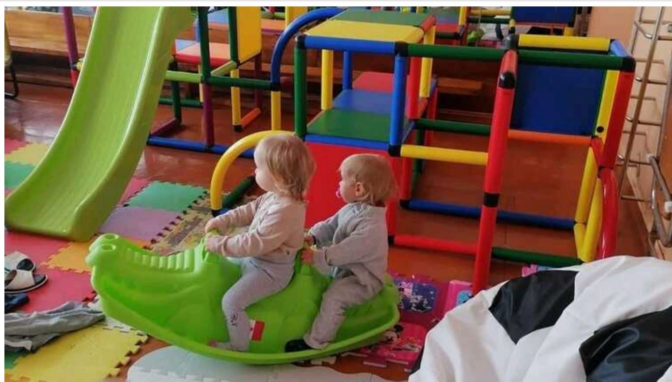
У Сумах через загрозу обстрілів проводять евакуацію місцевого будинку дитини

Рада оборони Сумської області ухвалила рішення про евакуацію вихованців "Сумського обласного спеціалізованого будинку дитини". Це рішення було прийнято у зв'язку з безпековою ситуацією в регіоні.