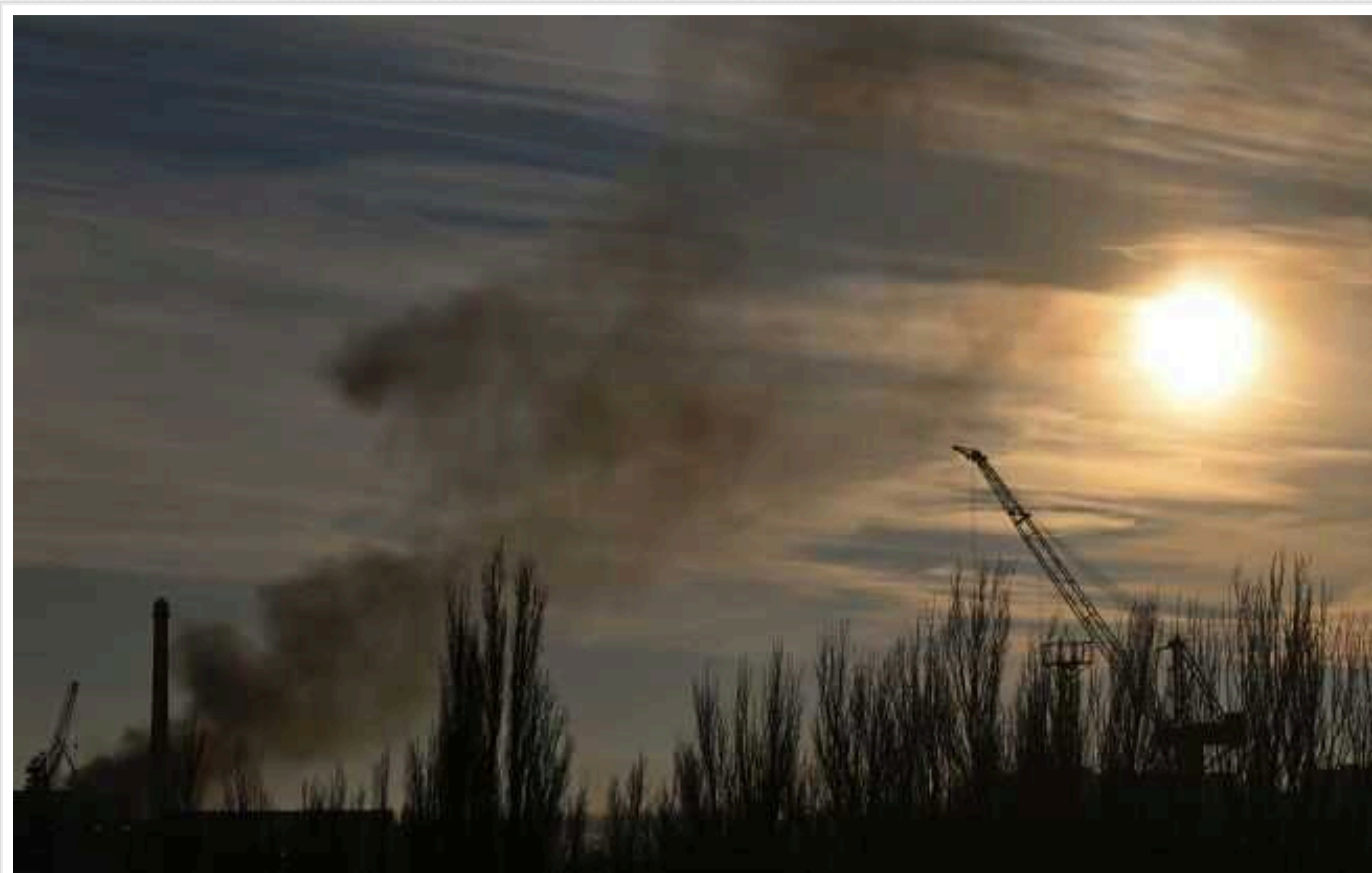
У Запоріжжі пролунали вибухи

Сьогодні увечері, 22 вересня, в Запоріжжі пролунали вибухи під час повітряної тривоги в регіоні. Раніше була оголошена загроза авіаударів з боку ворога.