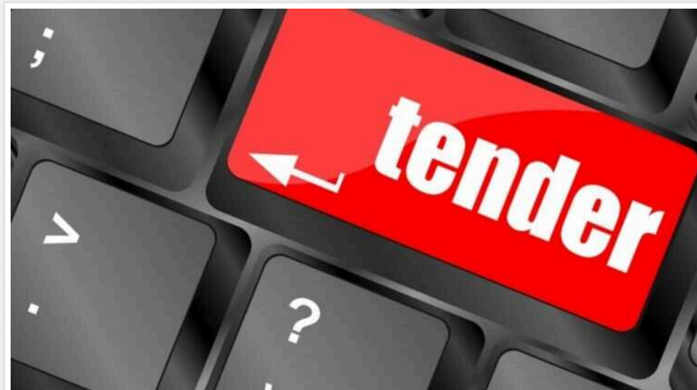
«Агенція оборонних закупівель» побила рекорд по дешевизні мавіків із тепловізорами: уклали угоди на постачання по 139 670 гривень

ДП «Агенція оборонних закупівель» Міноборони у вересні за результатами тендерів уклала угоди на постачання 1300 дронів DJI Mavic різних модифікацій на 162,69 млн грн.