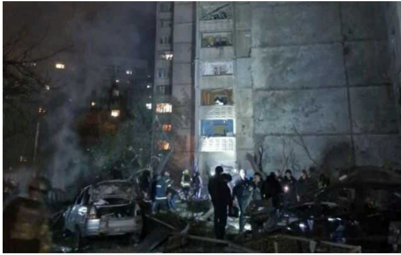
Удар окупантів по Харкову: пошкоджено 18 багатоповерхівок, двоє людей у дуже важкому стані

Вчора вночі, 22 вересня, окупанти здійснили обстріл Харкова з використанням КАБів. В результаті атаки постраждали 18 багатоповерхових житлових будинків, двоє людей перебувають у дуже тяжкому стані.