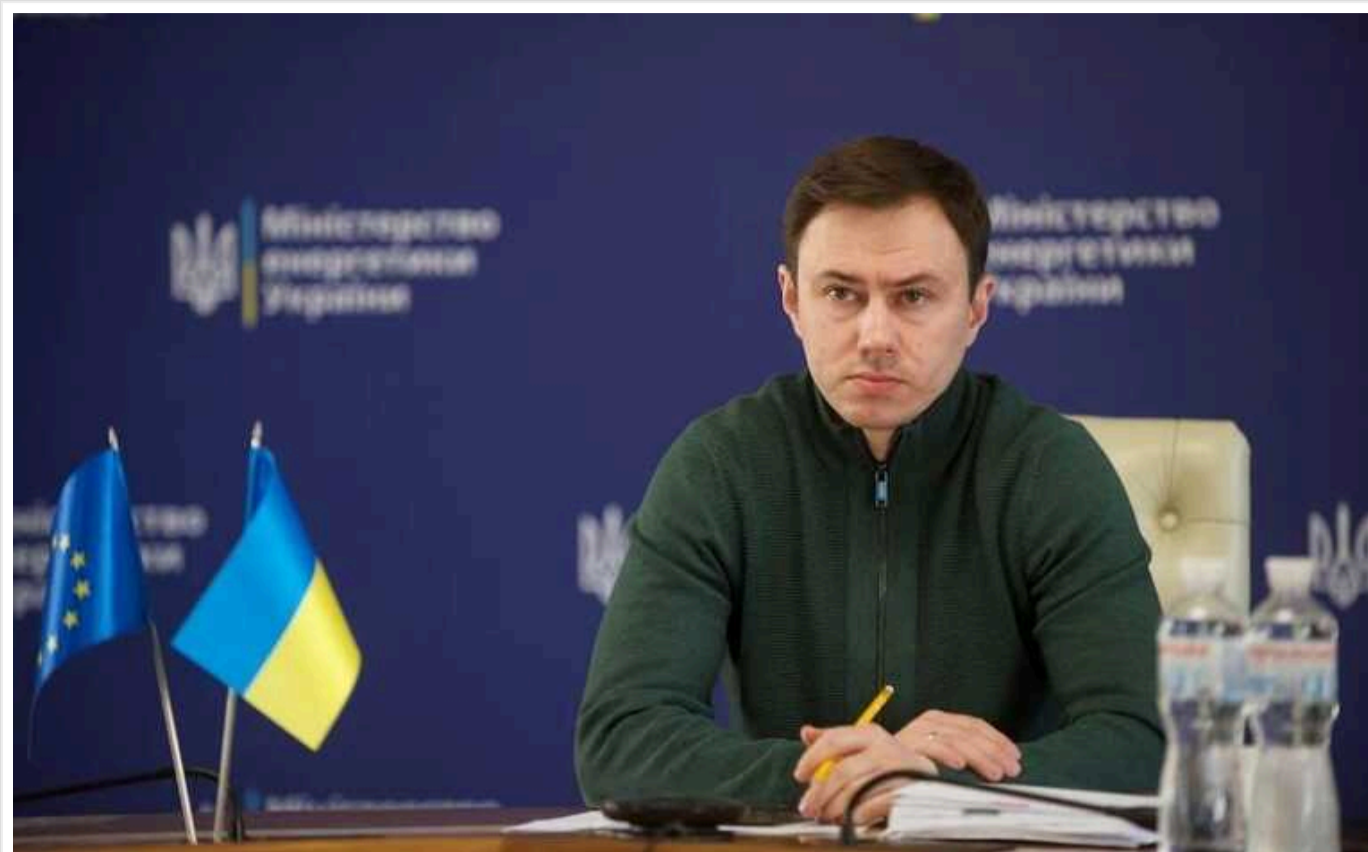
3 жовтня 2022 року РФ завдала понад 1000 ударів по об'єктах енергетики

3 жовтня 2022 року російські війська завдали більш ніж 1000 ударів по українських енергетичних об'єктах. Україна втратила значну частину генерації.