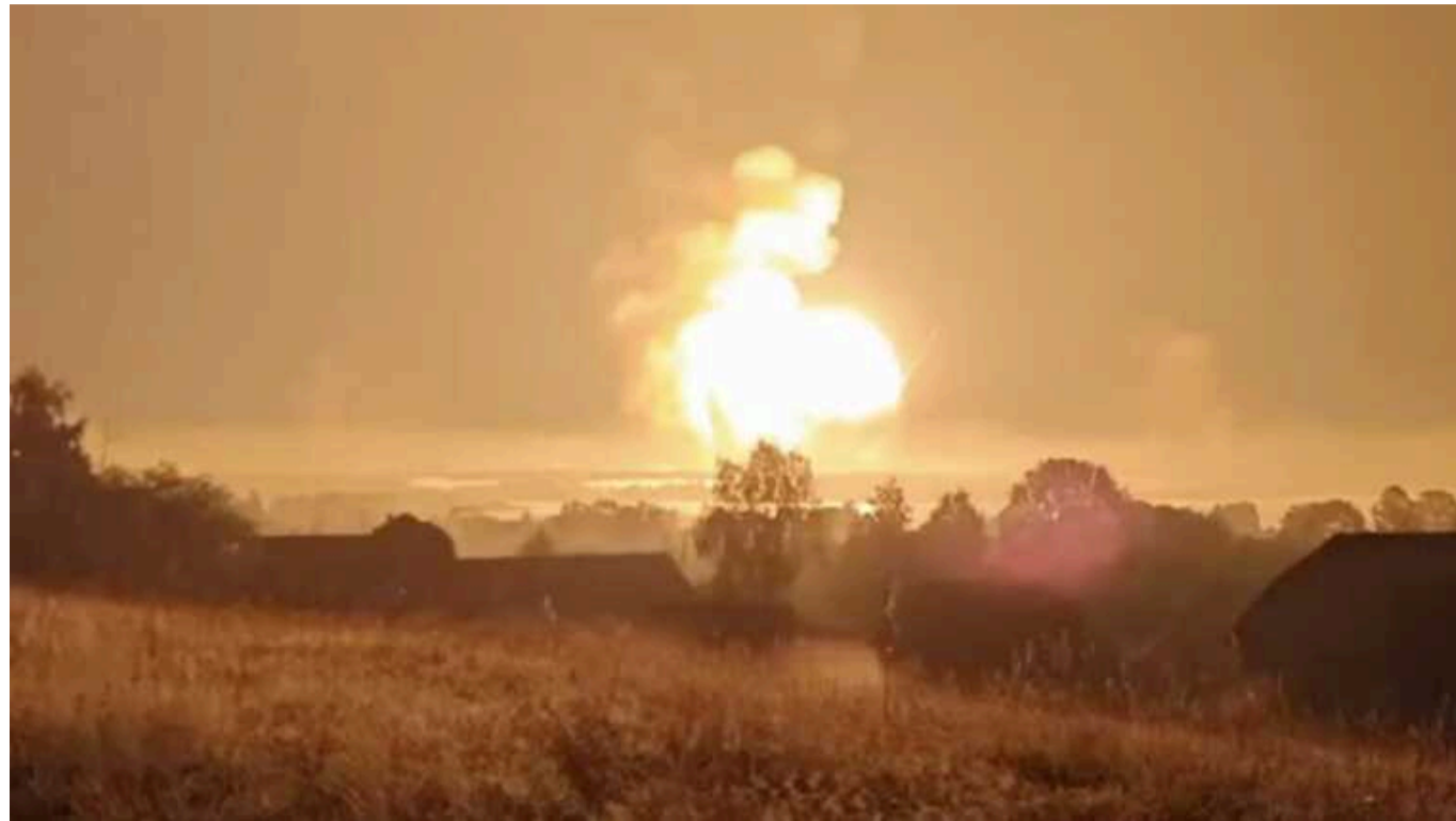
Удар по другому складу загарбників під Торопцем: в мережі з'явилися свіжі знімки супутникові знімки

З'явилися супутникові знімки наслідків удару по другому складу Росії поблизу Торопця. Знімки були зроблені 22 вересня.