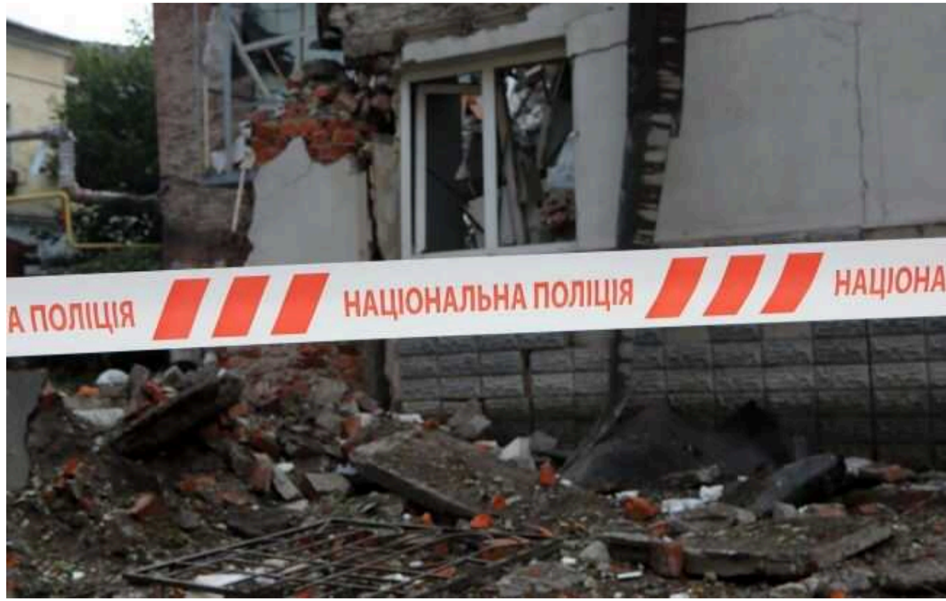
Унаслідок ворожих ударів у Херсонській області поранено п'ятеро осіб

П'ятеро мирних жителів Херсонської області отримали поранення внаслідок атак російських окупантів, повідомив відділ комунікації поліції Херсонської області в неділю.