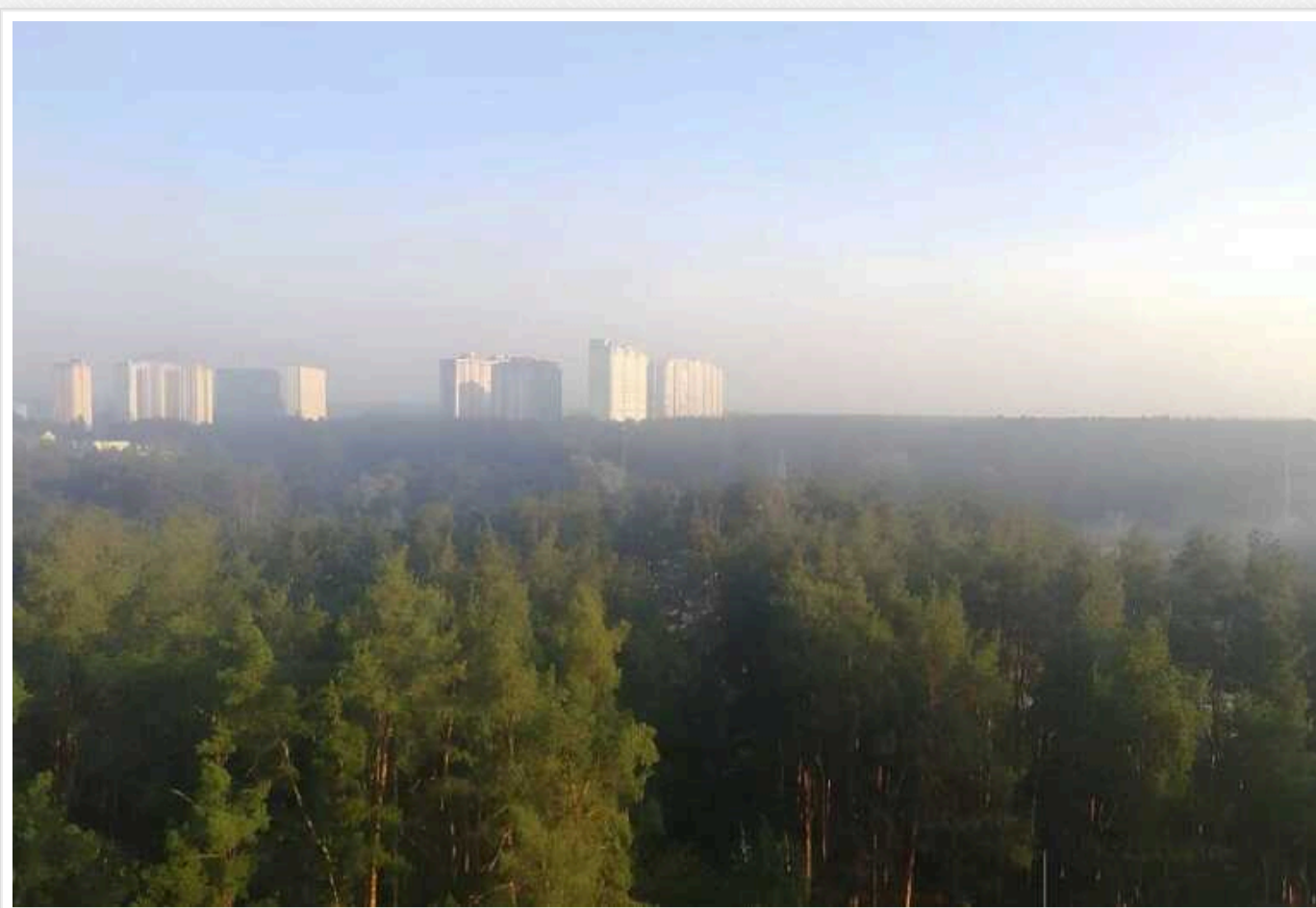
У двох районах Київщини погіршилася якість повітря

У Київській області погіршилася якість повітря. Зниження показників зафіксували у двох районах.