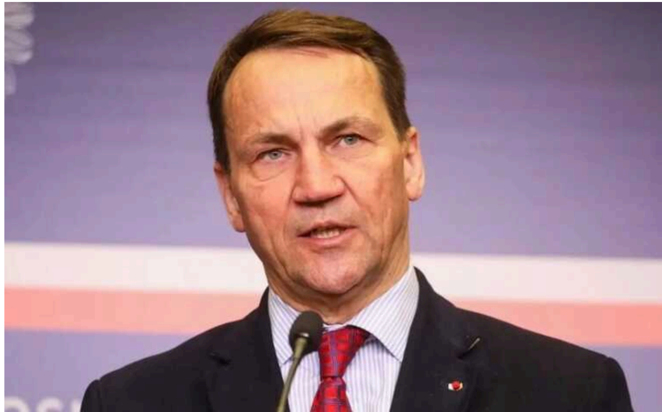
Сікорський прокоментував вступ України до ЄС: "Ми підтримуємо, але маємо свої вимоги"

Польща підтримує Україні в питанні вступу до ЄС. Проте на цьому шляху у Варшаві "є свої вимоги" до Києва.