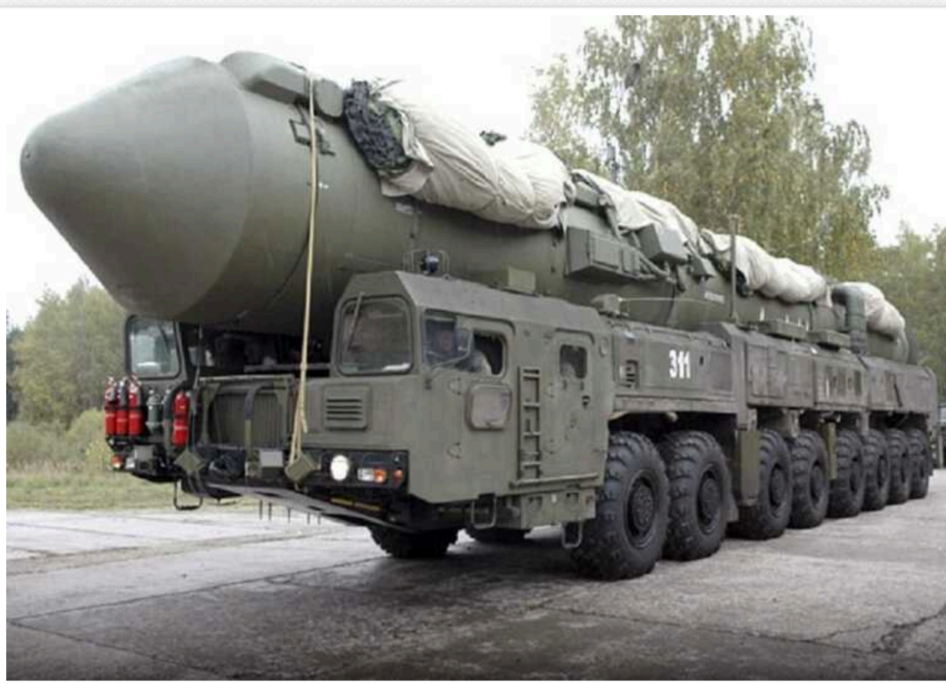
У мережі з'явилися нові супутникові знімки після невдалого випробування росіянами ракети «Сармат»

Російські військові провели невдале випробування міжконтинентальної балістичної ракети "Сармат", внаслідок чого вона вибухнула. У мережі з'явилися нові супутникові знімки наслідків вибуху.