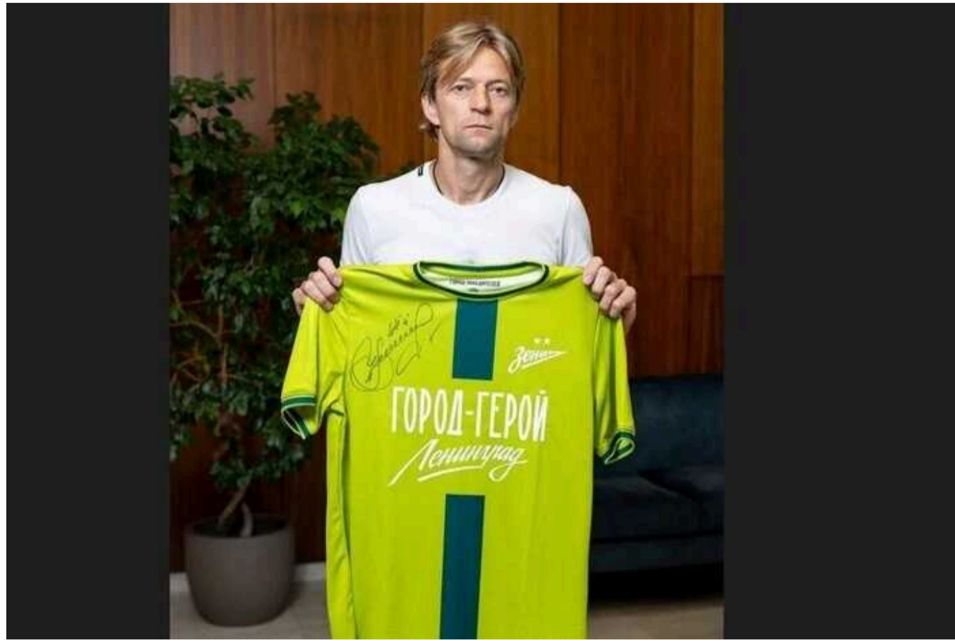
Зрадник Тимошук передав свою футболку з автографом для аукціону, який збирає кошти для окупантів

Футболка Тимошука була реалізована за 700 тисяч рублів (приблизно $7500).