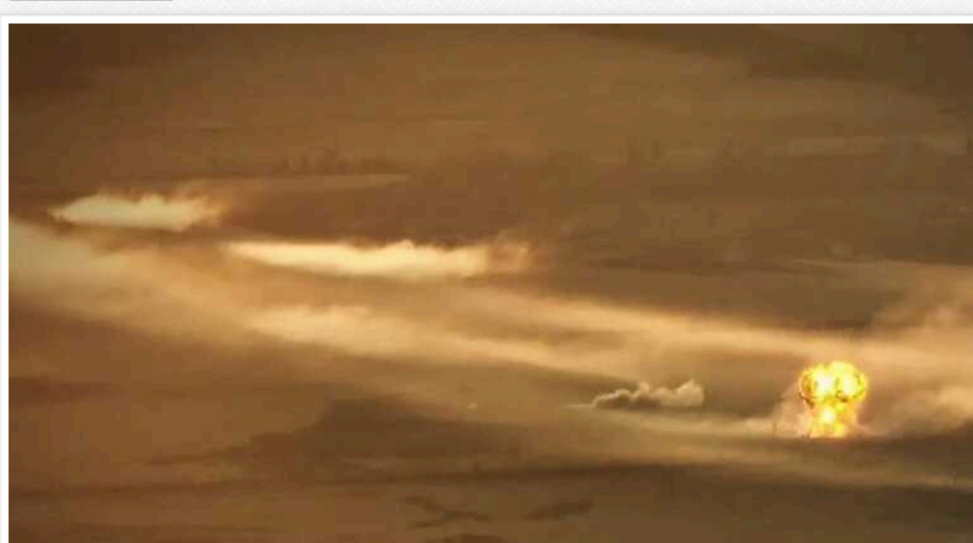
У Нацгвардії показали, як дали відсіч ворогу на Сіверському напрямку

Російські окупанти на Сіверському напрямку кинули на штурм українських захисників значну кількість живої сили за підтримки важкої техніки, однак спроба ворога виявилася невдалою. Нацгвардійці завдали ворогові потужної відсічі та спричинили йому серйозні втрати – залишки російської піхоти змушені були відійти з поля бою.