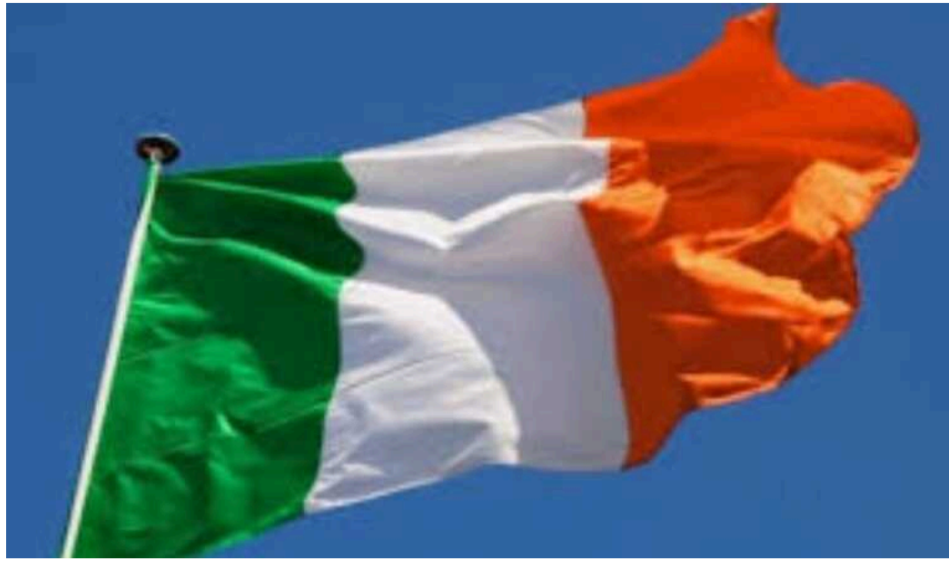
Ірландія скасувала свої плани щодо законопроекту про мову ненависті

Ірландія не вводитиме закони проти мови ненависті після критики з боку деяких законодавців, опонентів та мільярдера Ілона Маска.