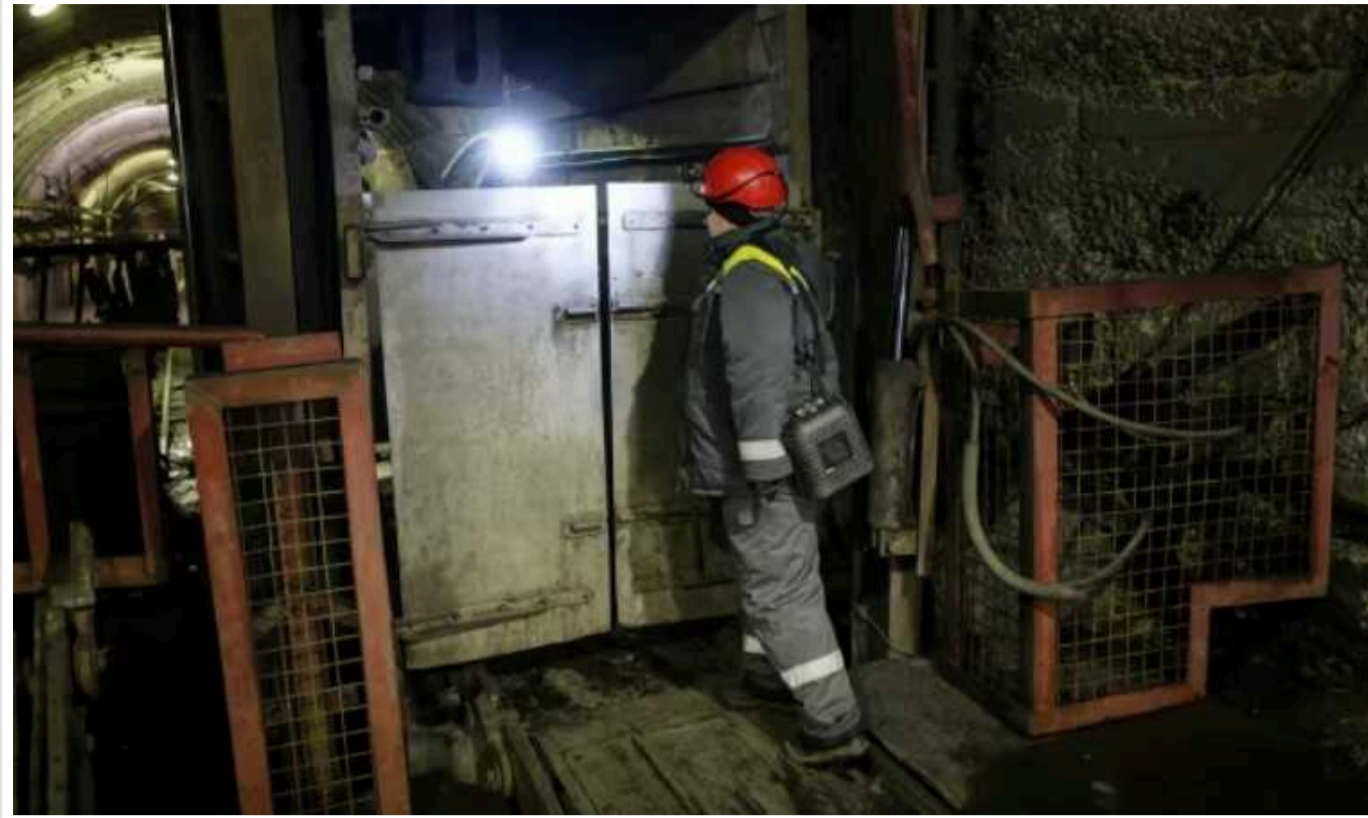
У Донецькій області через обстріл загинули дві працівниці шахти

Внаслідок обстрілу росіянами території шахти в Донецькій області сталася пожежа, є загиблі.