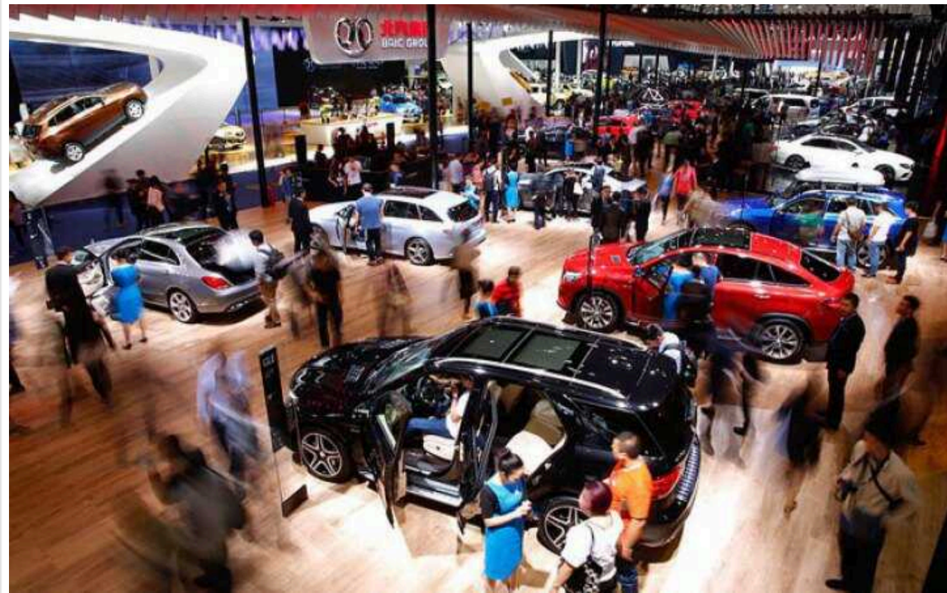
Reuters: США планують заборонити китайське ПЗ в автомобілях

Міністерство торгівлі США має намір заборонити китайське програмне та апаратне забезпечення в автомобілях із огляду на національну безпеку.