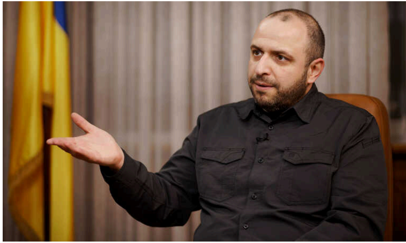
Україна представила партнерам проєкт програми масового виробництва ракет, - Умеров

Міністерство оборони України розробило й презентувало західним союзникам проєкт програми з масового виробництва ракет на території України.