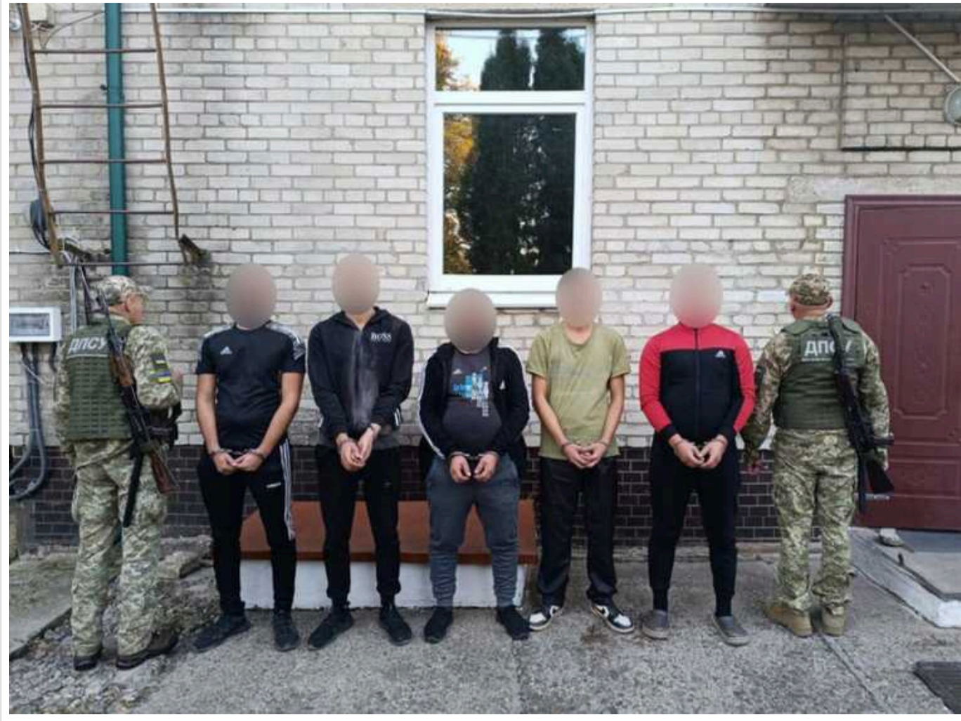
За 500 метрів до кордону з Румунією прикордонники затримали п'ятьох закарпатців, - ДПСУ

П'ятеро жителів Закарпаття намагалися незаконно потрапити до Румунії, проте їх затримали за 500 метрів до кордону.