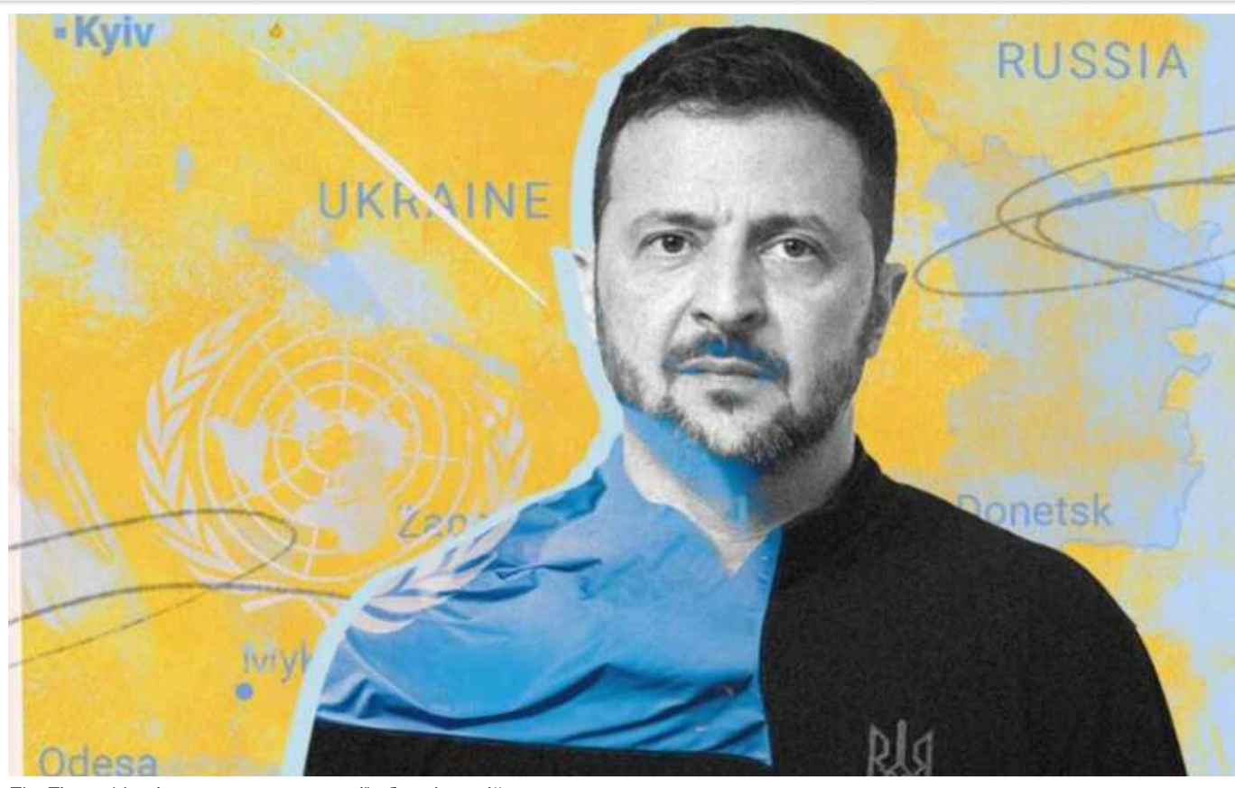
The Times: Мир із втратою території або «вічна війна»

Незважаючи на «план перемоги» Зеленського, думки про перемогу в Києві і Заходу можуть різнитися, зазначає оглядач The Times Марк Галеотті.