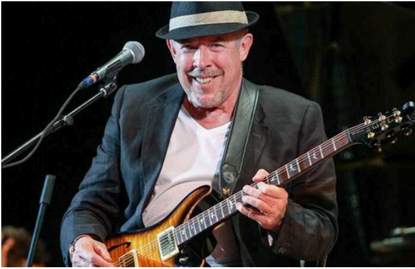
Російський співак Макаревич прокоментував свій статус "іноагента" в Росії

Лідер відомого російського гурту "Машина времени" Андрій Макаревич, який із 2014 року засуджує путінський режим та війну проти України, прокоментував статус "іноагента" в Росії, який отримав у вересні 2022 року. Музикант, який нині живе в Ізраїлі, зазначає, що це принижує його людську гідність.