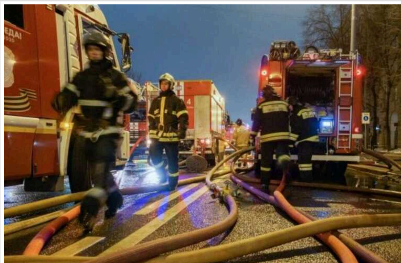
У Ростовській області РФ сталася пожежа після атаки БПЛА

У Ростовській області в ніч проти 22 вересня пролунали вибухи внаслідок атаки безпілотників. У Міллерівському районі виникла пожежа.