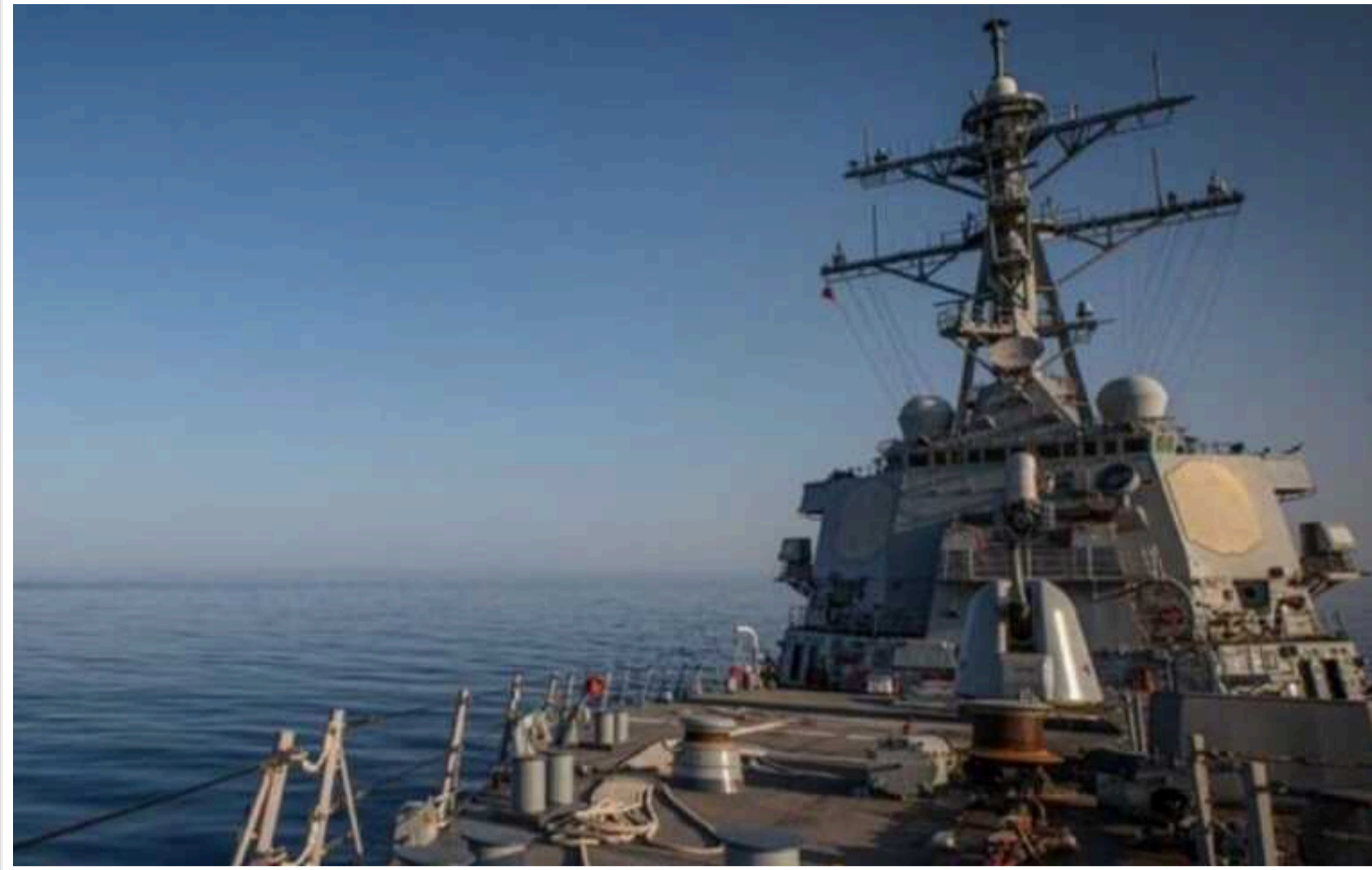
Американські військові знищили дрон хуситів над Червоним морем

Минулої доби американські військові знищили дрон еменських хуситів над Червоним морем.