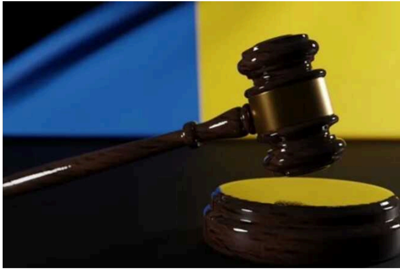
На Рівненщині чоловік ухилився від мобілізації: його оштрафували

У Сарненському районі Рівненської області судили місцевого жителя, який проігнорував повістку про виклик у ТЦК для відправлення в бойову частину. Він визнав свою провину й отримав штраф.