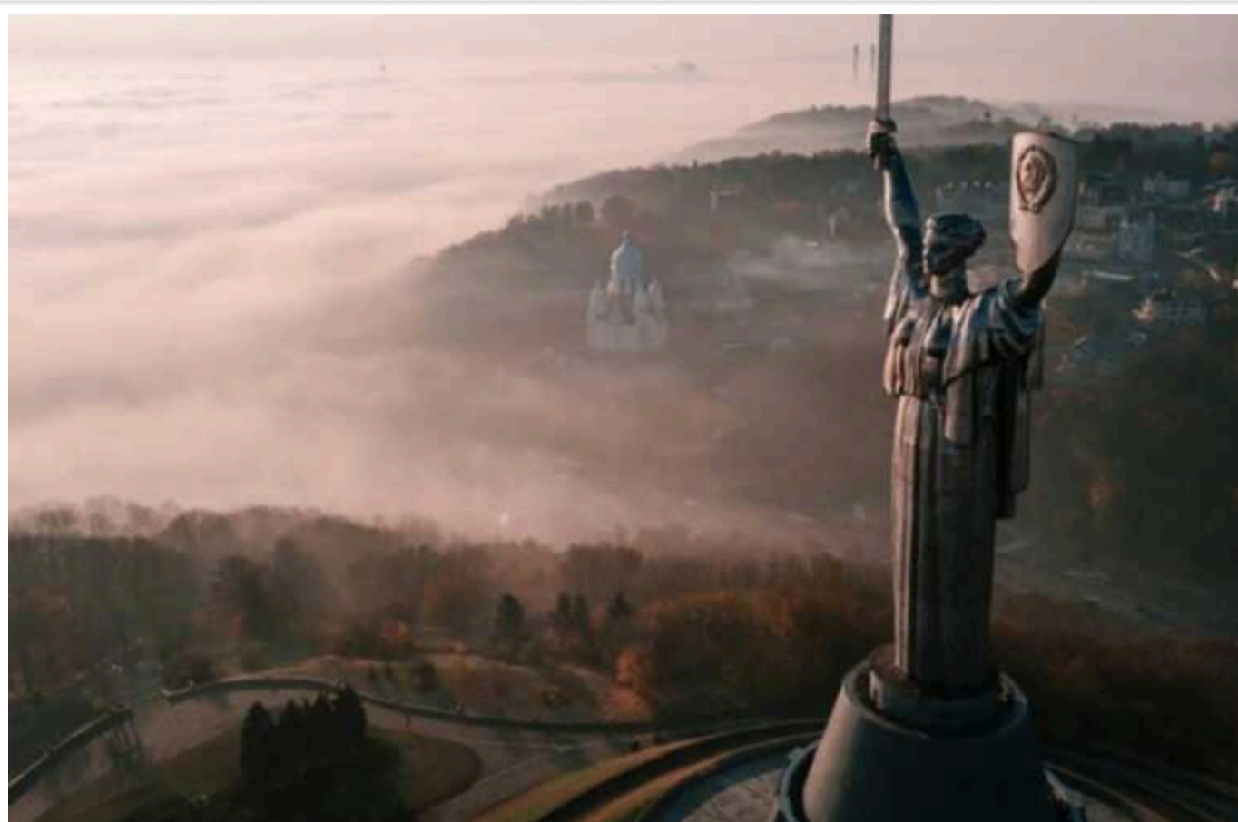
У столиці зберігається висока забрудненість повітря

Станом на ранок 22 вересня в Києві спостерігається високий рівень забруднення повітря, причому в деяких районах, особливо на лівому березі, забрудненість є "дуже високою".