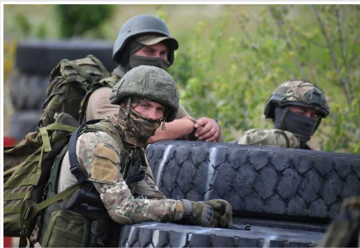
Російські війська просунулися в напрямку Курахового і вже за 3 кілометри від східної межі міста, – DeepState

Цю інформацію подано на карті українського військового пабліка DeepState.