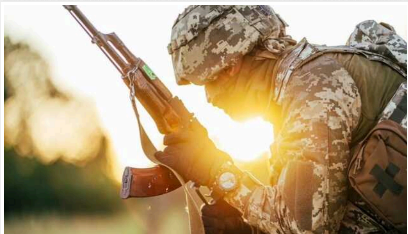
Ситуація на фронті: відбулось 163 боєзіткнення, окупанти концентрували атаки поблизу Селидового

На фронті минулої доби було зафіксовано 163 бойових зіткнення Сил оборони України з російськими агресорами.