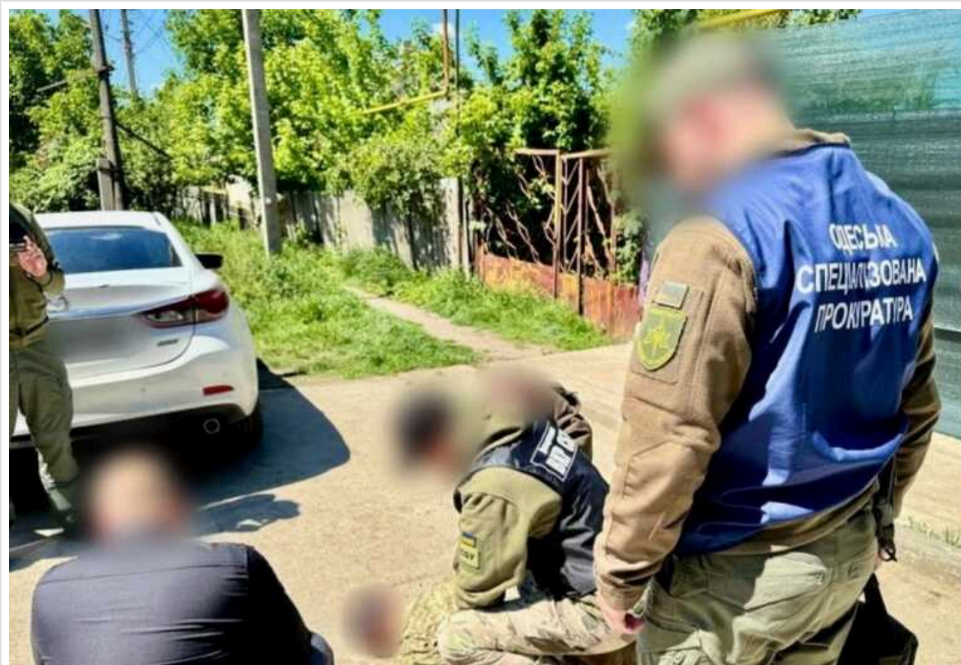
Працівник Подільського РТЦК Одеської області вимагав 300 літрів пального за документи про бронювання