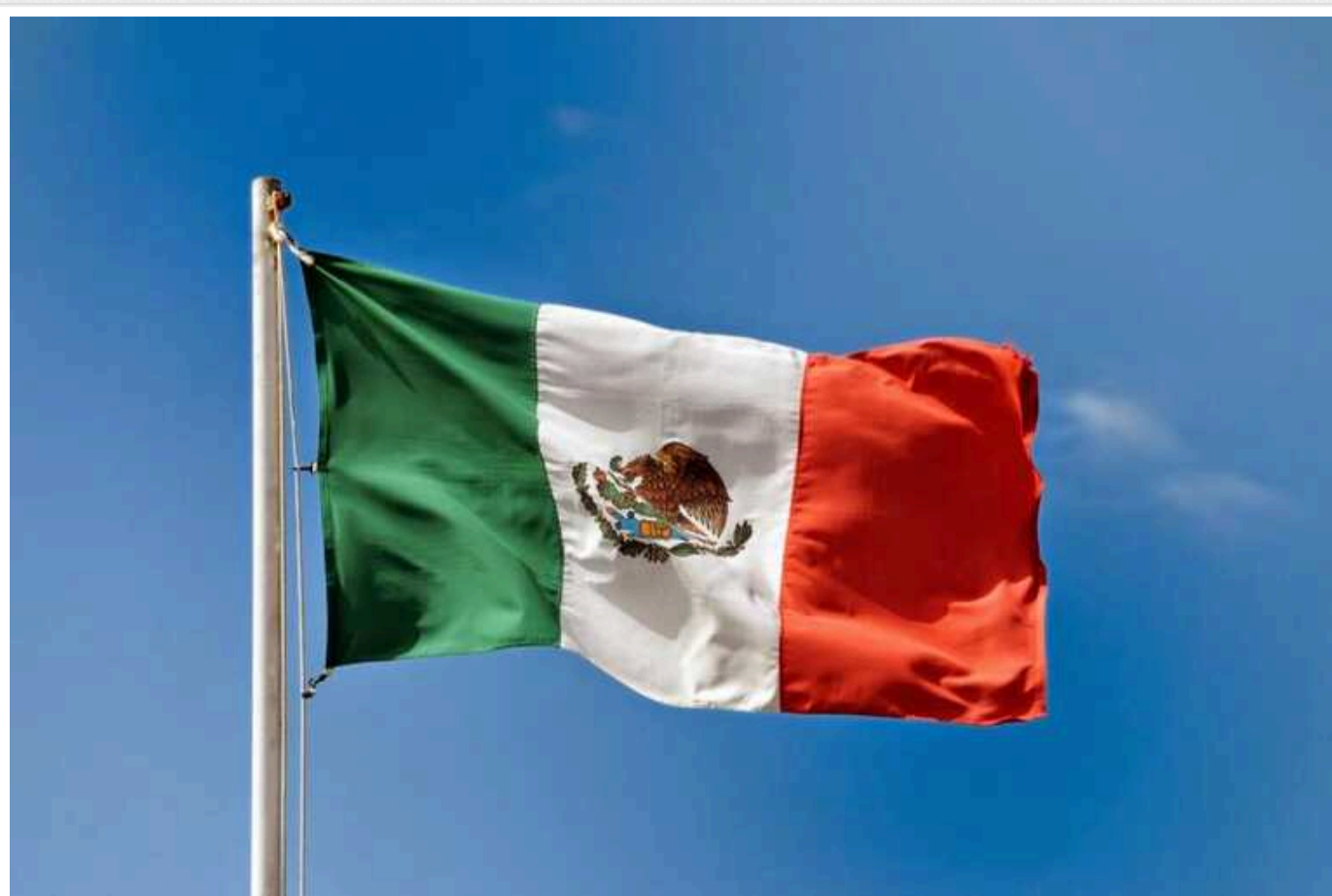
Росія використовує Мексику як платформу для шпигунства проти США, - NBC News

Російські спецслужби посилюють свою діяльність у Мексиці з метою проведення шпигунських операцій против Сполучених Штатів, що є відтворенням практик часів Холодної війни.