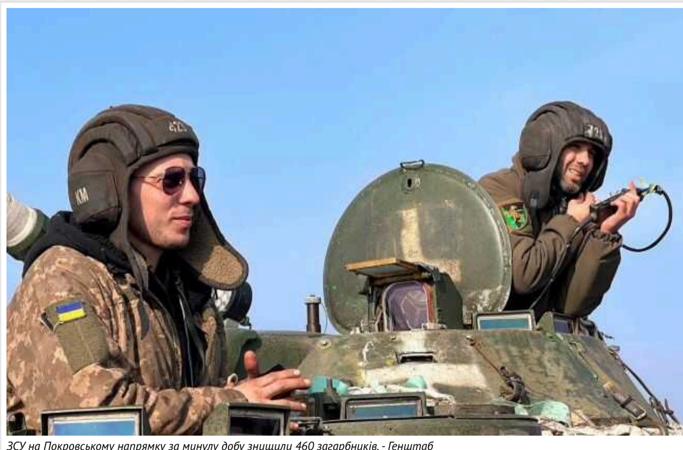
ЗСУ на Покровському напрямку за минулу добу знищили 460 загарбників, - Генштаб

На фронті впродовж доби 21 вересня до вечора було зафіксовано 125 бойових зіткнень. Понад половину з них - на Покровському, Лиманському та Курахівському напрямках.