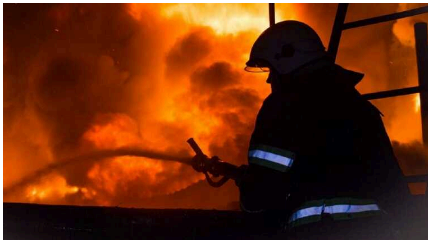
Авіаудар по Харкову та області: серед постраждалих є діти