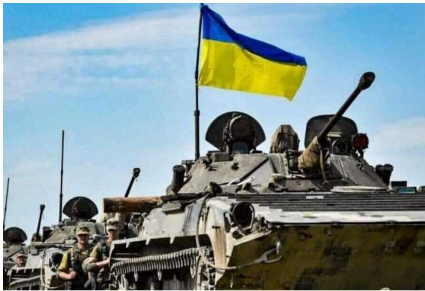
Ситуація на фронті: відбулося понад 80 бойових зіткнень

На фронті за добу суботи, 21 вересня, сталося 81 бойове зіткнення Сил оборони України з російськими загарбниками. Зокрема, російські літаки здійснили удари 12 КАБами по своїй території - у Курській області.