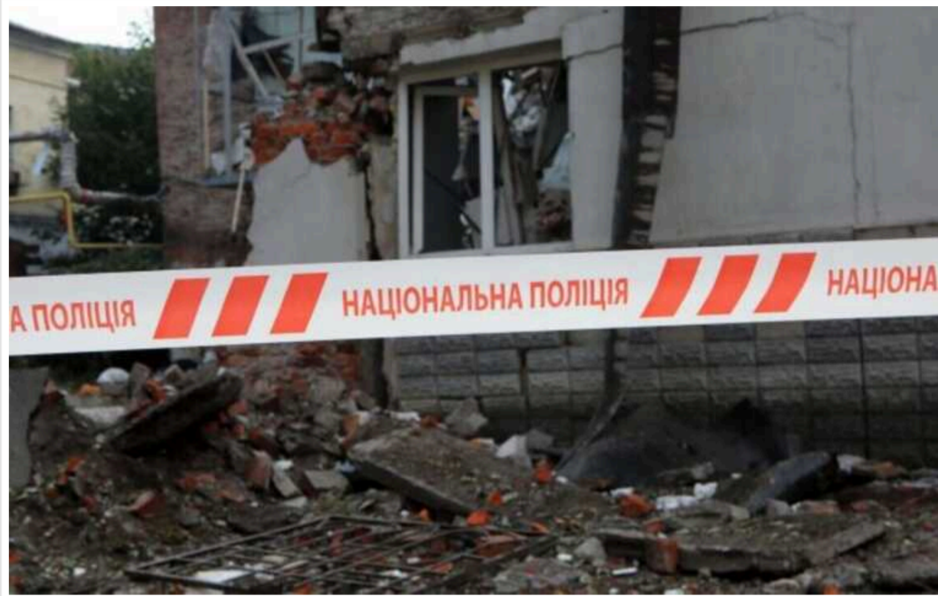
Окупанти завдали удару КАБом по Курахову: є загиблий

Унаслідок обстрілів з боку Росії на Донеччині в суботу, 21 вересня, у Кураховому загинула місцева мешканка. Ще семеро людей у регіоні зазнали поранення.