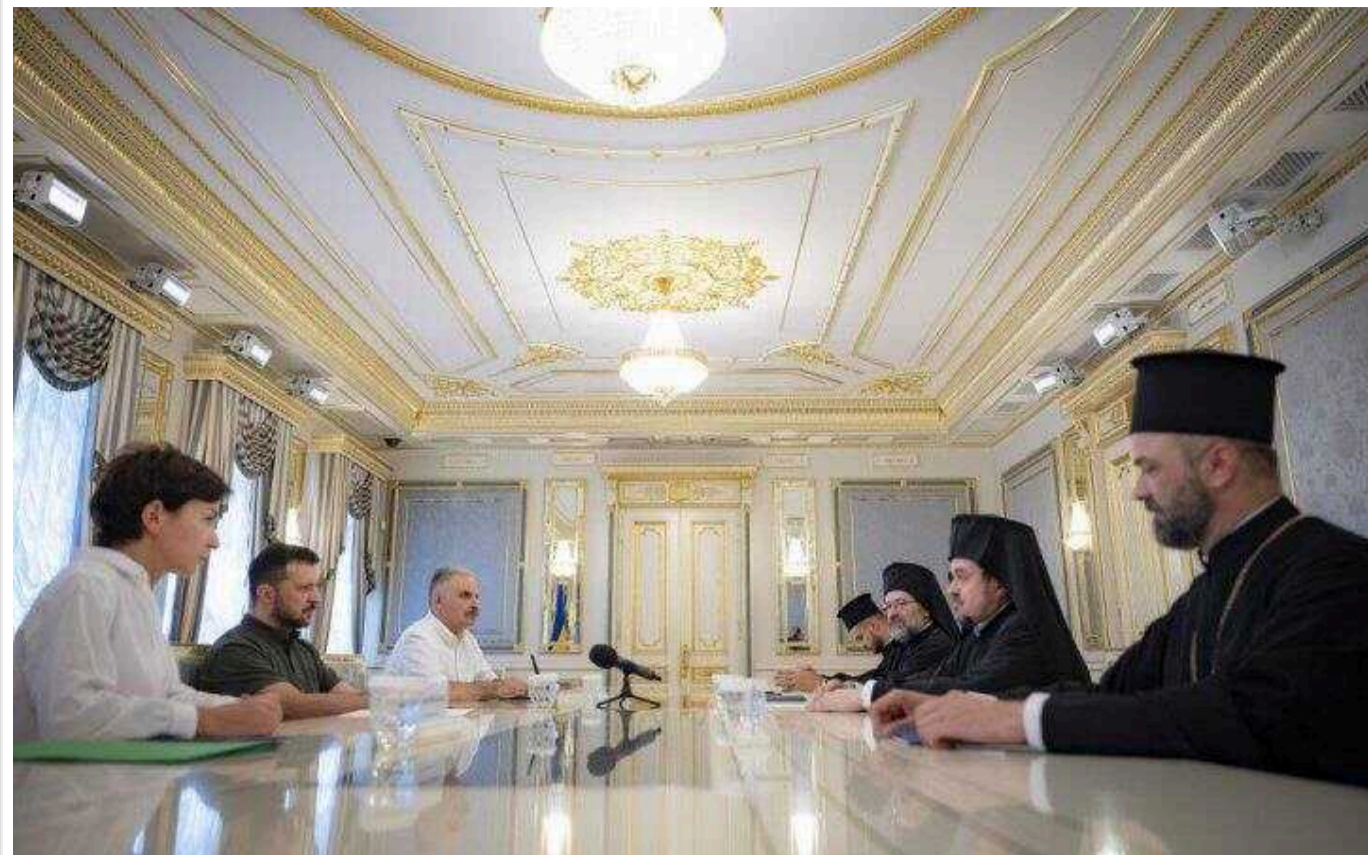
Зеленський звернувся до Константинополя із закликом підвищити статус ПЦУ до патріархату

Це він заявив вчора в інтерв'ю журналістам. Сам заклик був озвучений ще в кінці серпня під час зустрічі з послами Вселенського патріарха, які відвідали Київ.