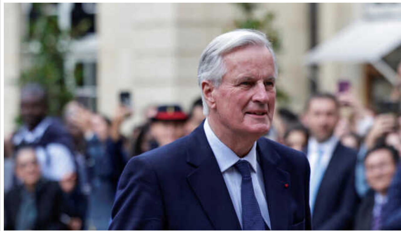
У Франції представили новий уряд Мішеля Барньє

У суботу пізно ввечері після більш як двох тижнів інтенсивних переговорів з усіма політичними силами французам представили урядову команду нового прем'єр-міністра Мішеля Барньє.