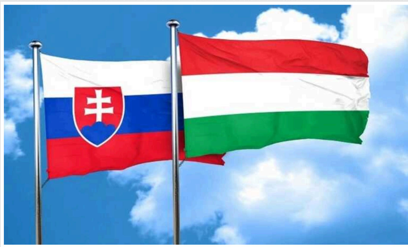
У РФ заявили, що Словаччина та Угорщина єдині в ЄС не загрожують "традиційним цінностям"

Російська влада ухвалила рішення не включати Словаччину та Угорщину – єдині дві країни з Європейського Союзу – до списку держав, політика яких "нав'язує неоліберальні принципи, що суперечать традиційним російським цінностям".