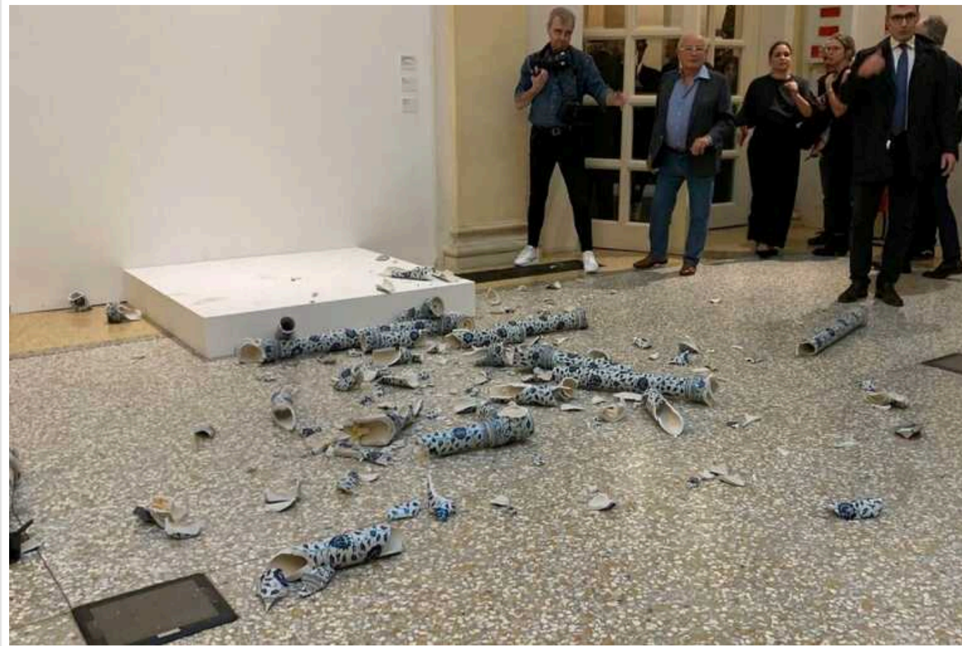
В Італії затримали громадянина Чехії, який знищив скульптуру на виставці

Поліція італійського міста Болонья затримала 57-річного громадянина Чехії, який 20 вересня розтропив скульптуру китайського художника і дисидента Ай Вейвєя під час відкриття його виставки.