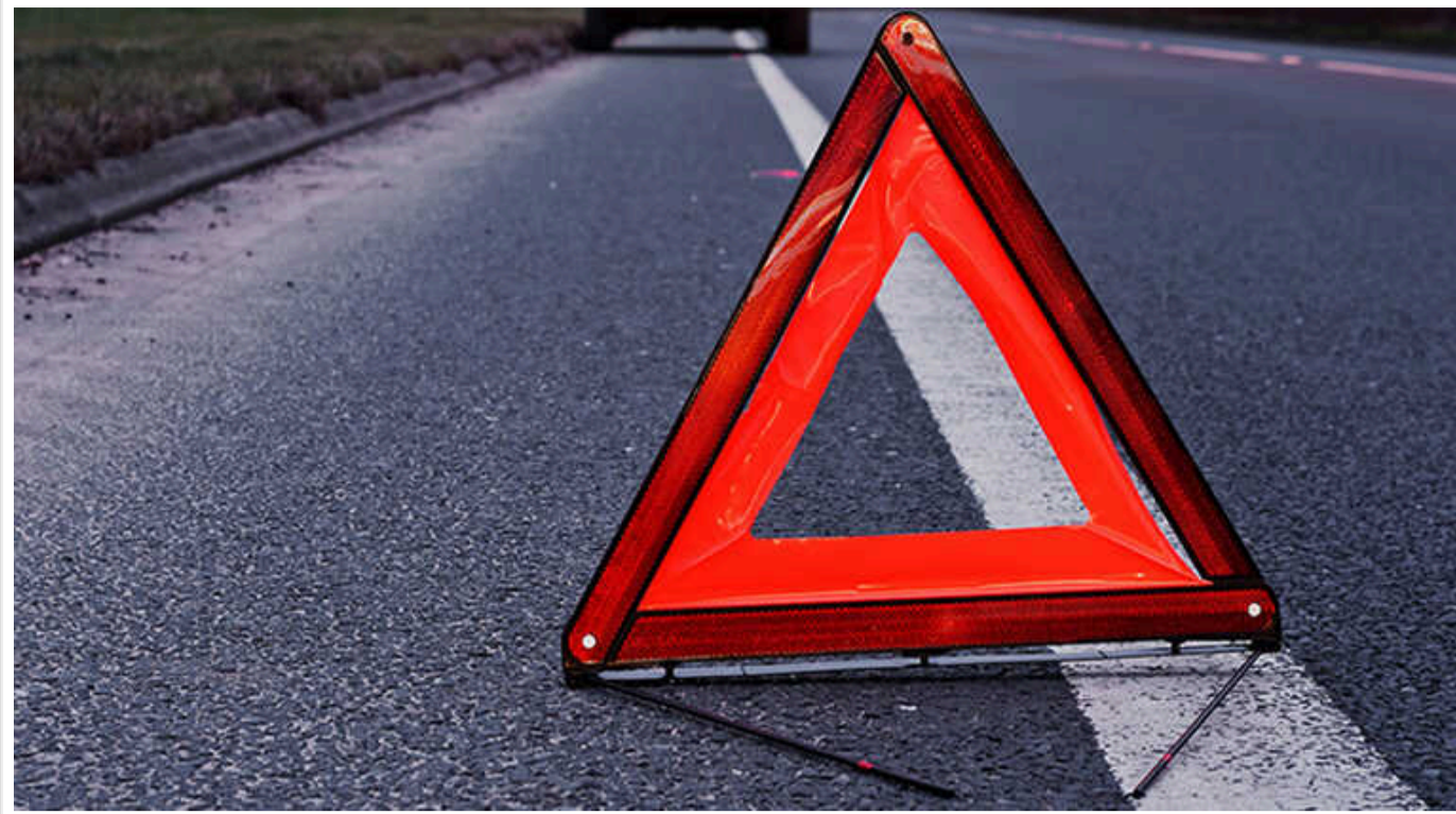
У Сербії військовий автомобіль зіткнувся з цивільним транспортним засобом: є загиблі та поранені

Неподалік сербського міста Уштьє вдень у суботу, 21 вересня, мобільний зенітний комплекс PASARS сербської армії зіткнувся з легковим автомобілем.