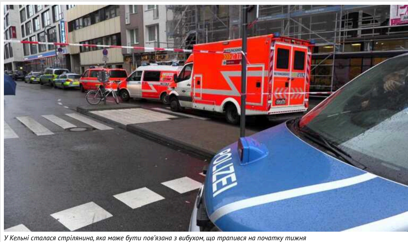
У Кельні сталася стрілянина, яка може бути пов'язана з вибухом, що трапився на початку тижня

Німецька поліція проводить розслідування стрілянини в годинникової крамниці в Кельні, яка сталася вранці в суботу, 21 вересня, на предмет можливого зв'язку з нещодавньою серією вибухів у місті.