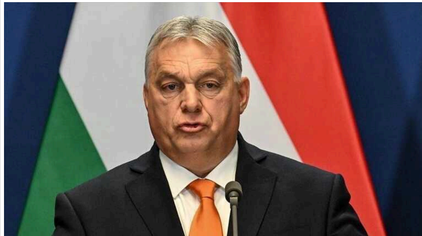
Ми не повинні ставати в позу жebraка, - Орбан про допомогу ЄС через повені

Прем'єр-міністр Угорщини Віктор Орбан зазначив, що країна повинна покладатися на власні ресурси для усунення наслідків повені, яка триває з початку цього тижня, а не звертатися за фінансуванням до ЄС.