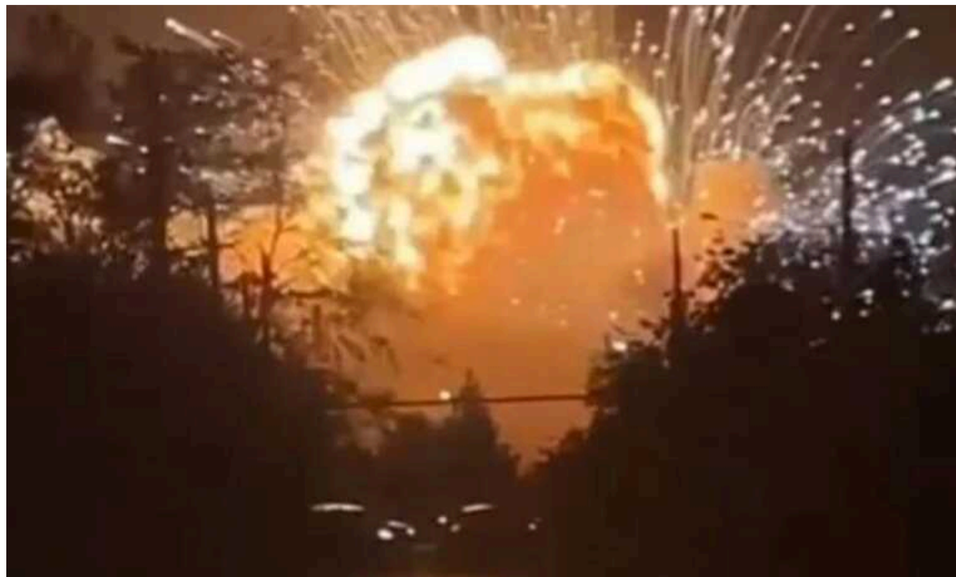
З'явилися супутникові знімки наслідків атаки на арсенал «Тихорецьк» у РФ

На російському арсеналі «Тихорецьк» продовжується пожежа після атаки українських сил. Її можна зафіксувати на супутникових знімках.