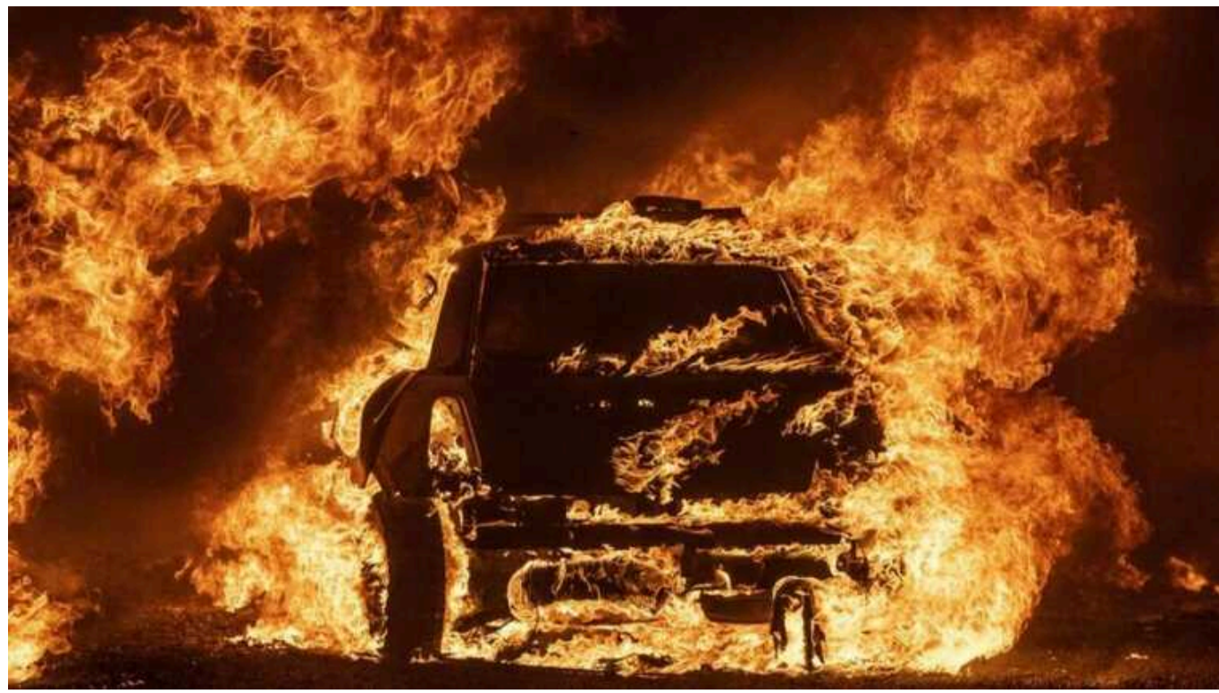
Із початку року на території України спалили 266 автомобілів, що належали військовослужбовцям і волонтерам