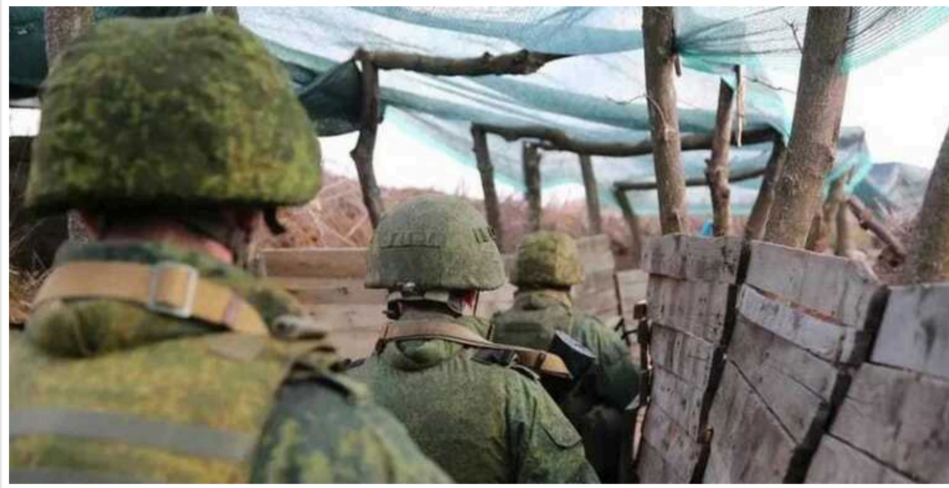
DeepState показав нові успіхи армії РФ на Донбасі

Російські війська зробили крок вперед в районі Миколаївки, Цукурино в Донецькій області та Макіївки в Луганській області.