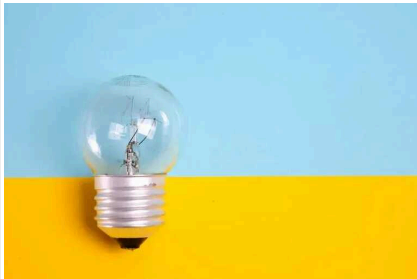
Завтра відключення світла не прогнозується, – Укренерго

У неділю, 22 вересня, не очікується застосування графіків відключення електроенергії.