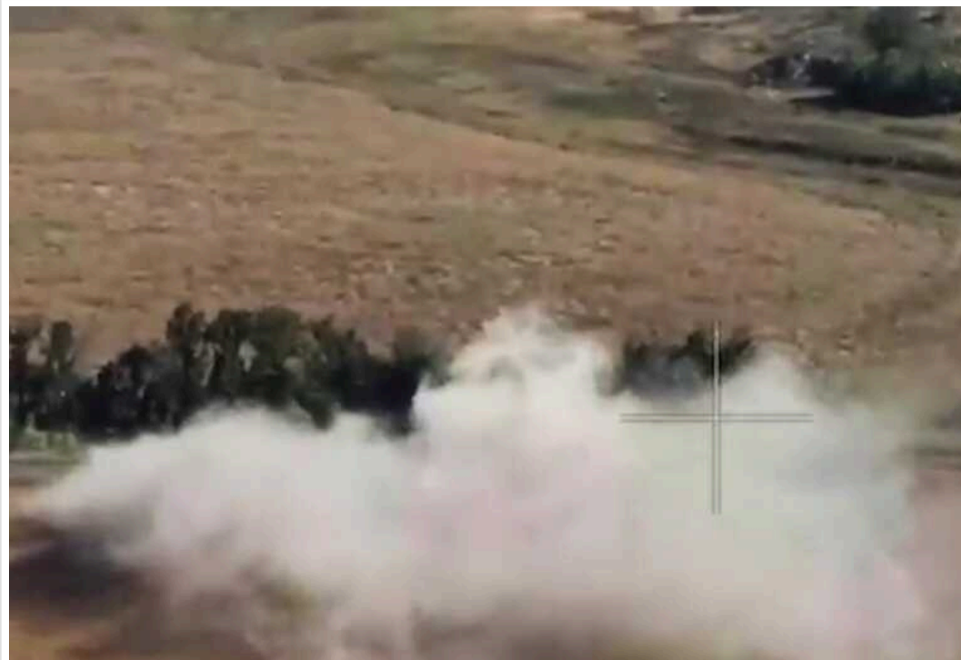
На Харківщині бійці 3-ї ОШБр розбили колону росіян

Військовослужбовці Третьої штурмової бригади знищили колону російських військ на Харківському напрямку. Бійці знищили танк і два бронетранспортери противника.