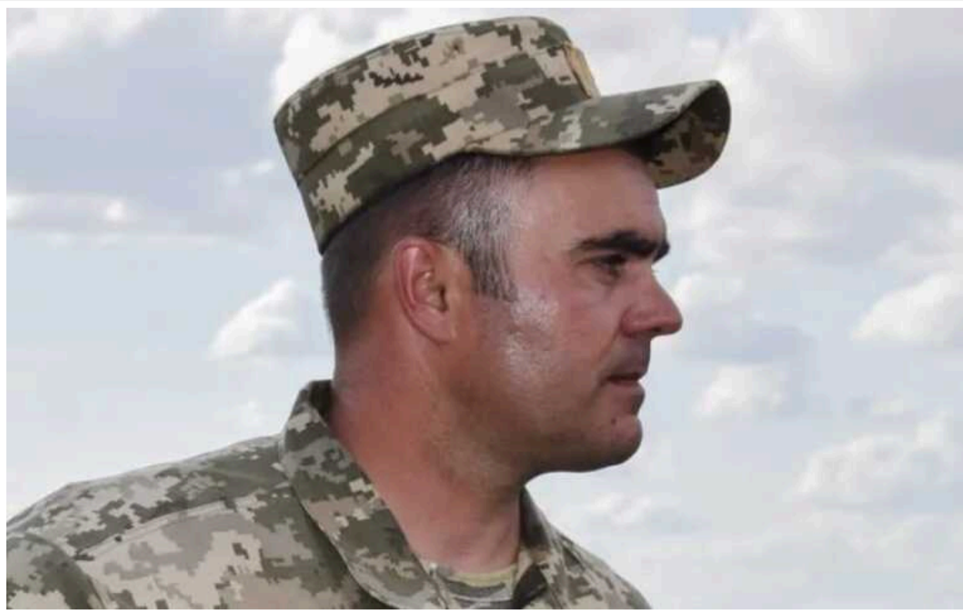
Командира 72 ОМБр Івана Вінніка звільнено з посади

Командира 72-ї окремої механізованої бригади імені Чорних Запорозжців Івана Вінніка звільнено з посади. Саме під його командуванням воїни підрозділу брали участь у боях за Бахмут та відбивали один з найбільших російських наступів за весь час війни під Вугледаром.