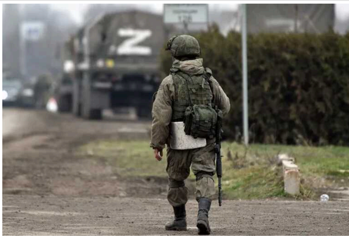
У РФ зросла кількість людей, які виступають за виведення військ з України, – опитування

На сьогодні майже половина росіян (49% опитаних) виступають за виведення російських військових з України без досягнення військових цілей, визначених Москвою. Вони також підтримують початок мирних переговорів.